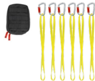
FALLSTOP® SET APAARR® SET6 Erweiterungssset