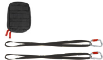
FALLSTOP® SET APAARR® SET3 Erweiterungssset