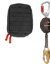
FALLSTOP® SET APAARR® SET2 Erweiterungssset