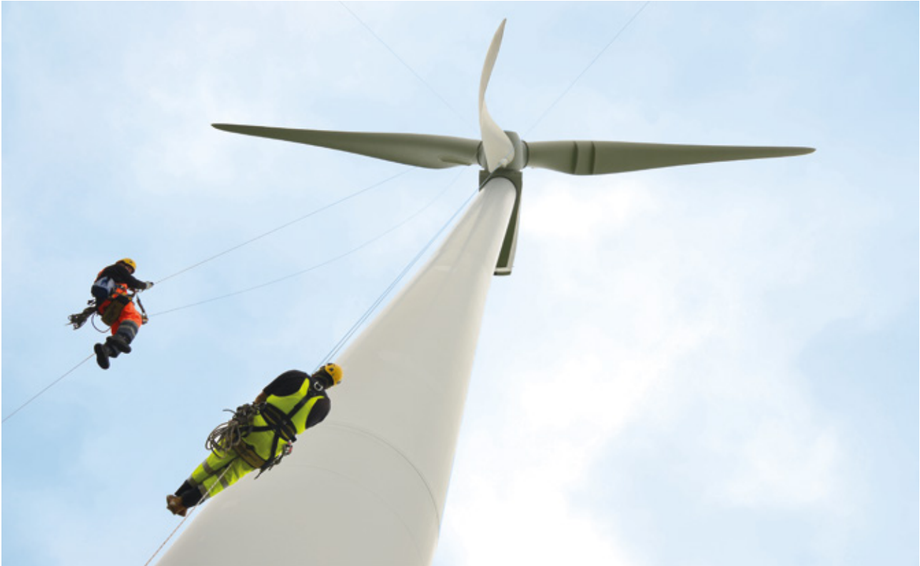
Einsatz am Windrad.