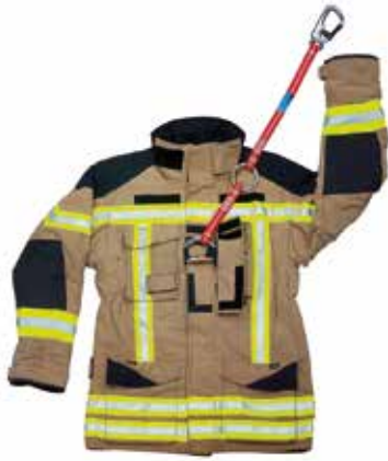
IRS-System integriert in eine Schutzjacke (hier von S-Gard mit patentierter Pattentasche)

Das integrierte Feuerwehr-Rettungsschlaufen-System IRS wird vollständig in der Feuerweherschutzjacke integriert und ist besonders für Einsätze mit Atemschutz geeignet. Das IRS-System erleichtert erheblich die Arbeit der Brandschützer: es erhöht deutlich das Sicherheitsniveau, reduziert Belastungen und ist schnell zur Hand.